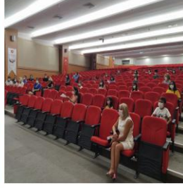
Şekil 4 Tarık Çakmak